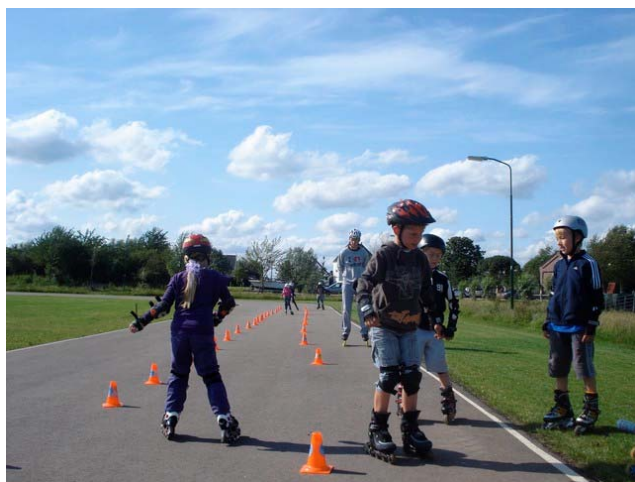
Zaterdagmiddag skeelerles jeugd

Afgelopen zomer verzorgde de leden van het team GOBAD op de zaterdagmiddag van 17.00 uur tot 18.00 uur een skeelertraining voor de jeugd.