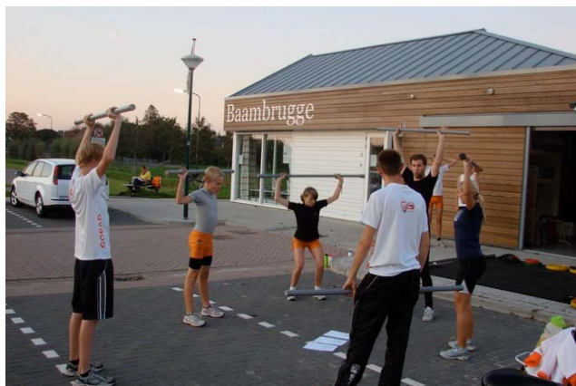
Krachttraining voor de GOBAD schaatsters

Team GOBAD is een schaatsteam dat wordt ondersteund door ons maar ook door de ijsclubs: Gein en Omstreken , Abcoude en Diemen . Deze ijsclubs onderhouden al vele jaren een goede samenwerking op het gebied van ijstrainingen op de Jaap Eden IJsbaan in Amsterdam. De afgelopen jaren hebben deze ijsclubs gemerkt dat het aantal fanatieke schaatsters bij de clubs sterk afnam, waardoor de ijsclubs langzaam vergrijzen.